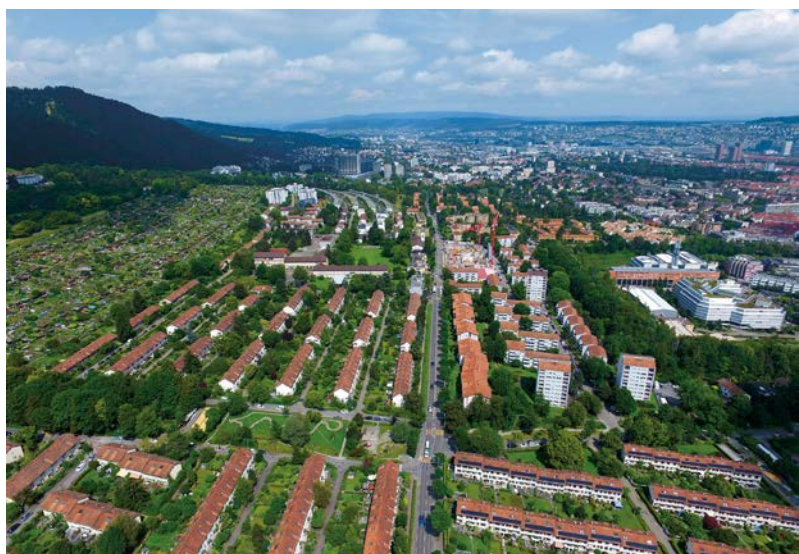
A Zurigo, in zona Friesenberg, è prevista la certificazione di un intero quartiere, edificato in 24 tappe.

L'idea di portare la natura in città si è affermata nello sviluppo urbanistico di Losanna; le politiche associative, promosse, ad esempio, tramite la «Piattaforma collaborativa Losanna Natura», sono indirizzate al verde. Tale Piattaforma rende possibili fruttuose collaborazioni con cerchie protezionistiche e dell'agricoltura urbana, a livello locale e nazionale. La Fondazione Natura & Economia partecipa attivamente all'annuale «Festa della natura», che si tiene in maggio.