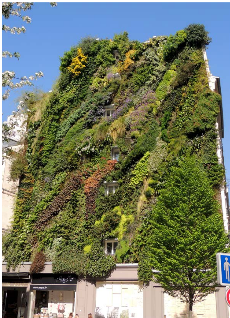
La città d'avanguardia: spettacolare giardino verticale di Patrick Blanc (Oasis d'Aboukir, Paris). Foto: Patrick Blanc

Notevole rilevare che si offre la possibilità di realizzare pareti verdi anche negli interni, con indubbi effetti positivi sul benessere. A parte l'effetto scenico, le facciate verdi temperano il clima urbano, proteggono gli immobili, attenuano il rumore, purificano l'aria (dalle polveri fini!), favoriscono la biodiversità, e non da ultimo danno alla popolazione una sensazione di benessere, orientando la città verso il futuro (così l'Ufficio federale dell'ambiente).